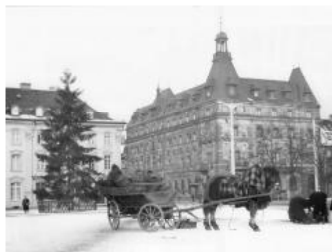
Das Parkhotel kurz vor der Zerstörung des Daches.

„Zur Ausbildung und Prägung eines »kulturellen Gedächtnisses« ... spielen Bauten, als exponierte und jedem direkt vor Augen stehende Zeugnisse der Vergangenheit, von jeher eine besondere Rolle. Mit einer Rekonstruktion wird im bewussten Rückgriff der verlorene »Erinnerungsort« als wichtiger Träger unterschiedlichster Bedeutungen wiederhergestellt.“