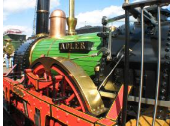
Das 175jährige Jubiläum der ersten deutschen Eisenbahn mit Dampfantrieb stand 2010 im Mittelpunkt.

Die Bahn selbst hat im Jubiläumsjahr praktisch nur negative Schlagzeilen gemacht. Auch ich als Heimatpfleger kann über sie nicht viel Positives berichten.