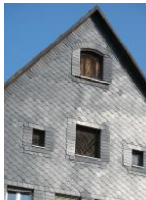
.. nach einer „fahrlässig“ genehmigten „Renovierung“ mit Kunstschiefer 2008...