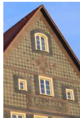
... und heute: Ende gut, alles gut, Es fehlt nur noch etwas Patina.

Derselbe Investor und dieselbe Architektin sind derzeit mit dem Umbau der ehemaligen Dorn-Bräu in Vach zu Lofts beschäftigt, auch hier gibt es nach jetzigem Stand nur Anlass zur Freude.