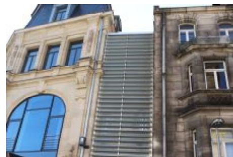
Kleiner Schönheitsfehler in der Ludwig-Erhard-Straße: Ich hatte mit dem Landesamt f. Denkmalpflege und dem Architekten eine zurückhaltende Verbindung in Sandstein vereinbart, das Bauamt wollte es anders: Die eigentlich untergeordnete Lücke wird nun durch den Kontrast zu stark betont.

Wenn auch im anderen Maßstab, so kann sich das Ergebnis der Rekonstruktion am Kohlenmarkt in Fürth sehen lassen und auch das Landesamt für Denkmalpflege stimmt heute – trotz anfänglicher Skepsis - uneingeschränkt zu. Die stärkere Betonung der Mittelachse des Bauwerks durch den Rollwerkzwerchgiebel bildet ein gutes Gegengewicht zu den sehr massiv ausgebildeten unteren Geschossen des Gebäudes. Manche bemängeln das - je nach Lichteinfall - mitunter blaue Schimmern des Glases, aber leider gibt es auf dem Markt keine farblosen Gläser, die auf einer solch großen Fläche den Anforderungen (Dämmwerte, Lichtschutz) gerecht werden. Neben vielen sehr gut gelösten Details sowohl an der Fassade (z.B. Türen zur Gartenstraße) wie auch im Innern ist der Lückenschluss an der Ludwig-Erhard-Straße als kleiner Wermuts-