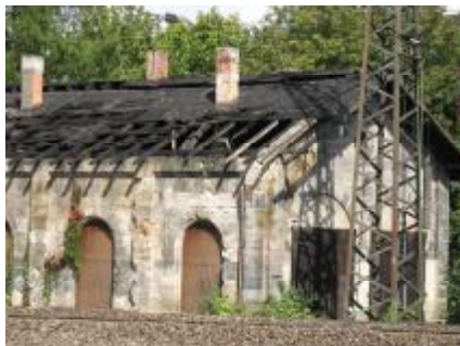
Der Lokschuppen an der Stadtgrenze ist dem Untergang geweiht, wenn nicht bald etwas geschieht...