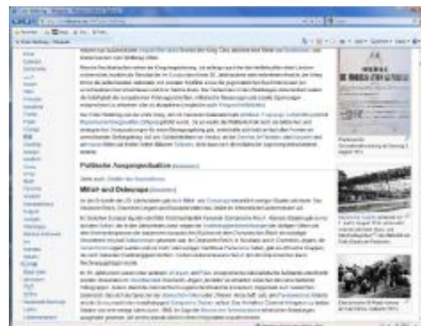
Wikipedia: Eine stark frequentierte und von mir mit betreute Seite ist „Erster Weltkrieg“. Hier habe ich u. a. ein Bild von der Mobilmachung in Fürth eingefügt. Der Kriegsbeginn wurde auch in Fürth von Teilen der Bevölkerung mit Begeisterung aufgenommen, wie das Bild leider nur zu deutlich zeigt (Mitte rechts). Vgl.: http://de.wikipedia.org/wiki/Erster_Weltkrieg

In dieser Internet-Enzyklopädie mit gewaltigen Zugriffszahlen (ca. 15 Milliarden Zugriffe jährlich) bin ich als Autor und als „Sichter“ (in etwa vergleichbar mit einem Lektor) tätig. Ich arbeite in Wikipedia auch Hinweise auf Fürth ein (natürlich nur dort, wo es sinnvoll ist), so dass damit indirekt Fürth als Stadt mit Geschichte eine immer größere Bekanntheit erlangt. Vorteil ist dabei, dass es bei uns viele einmalige Fotos von geschichtlichem Wert gibt, die von den die Urheber bzw. deren Erben zum allgemeinen Gebrauch freigegeben wurden, so dass sie auch in Wikipedia verwendet werden können - ein Beispiel ist der Fürther „Meisterfotograf“ Ferdinand Vitzethum.