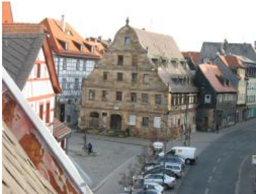
Keine Lösung in Sicht: Goldener Schwan.

Abgesehen vom historischen Lokschuppen an der Stadtgrenze gibt es leider eine Vielzahl von weiteren Problempunkten: