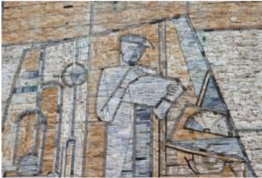
Mosaik (Ausschnitt) an der Berufsschule 1 (Turnstraße) – Rettung nach wie vor fraglich.