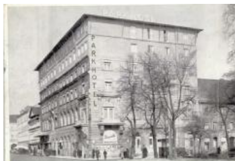
Das Parkhotel Ende der 1940er Jahre: Aufgestockt und neues Dach, aber noch nicht verputzt