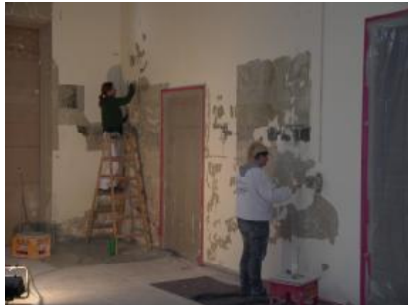
Die alten Farbschichten in der Jüdischen Aussegnungshalle wurden mühsam abgehoben und die darunter liegenden Farbfassungen begutachtet.

Neben diesen Abgründen gibt es aber auch dieses Jahr wieder viel Positives zum Denkmalschutz zu berichten. Ganz besonders hervorzuheben ist die Renovierung der Jüdischen Aussegnungshalle in der Erlanger Straße 99, die inzwischen nicht nur religiöse Bedeutung hat, sondern ein ganz besonderes Mahnmal darstellt. Vor der Sanierung standen wir vor der Frage, welche Fassungen der Innenwände wo sinnvoll sind? Unter den Farbschichten aus verschiedenen Renovierungen kamen die Farbfassungen um