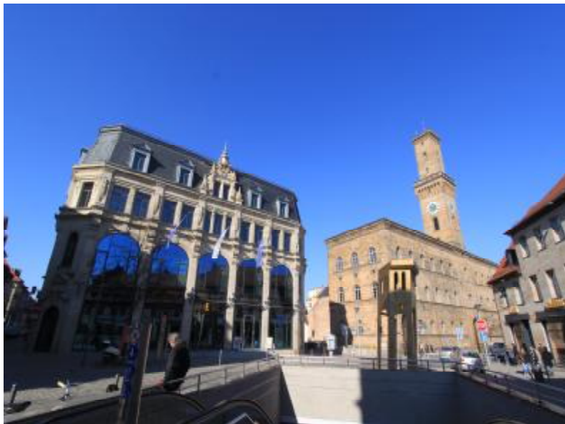
Top Sanierung 2010: Raiffeisen-Volksbank am Kohlenmarkt

Entsprechend der gesetzlichen Vorgaben in Art. 13 des bayerischen Denkmalschutzgesetzes muss der Heimatpfleger „durch die Denkmalschutzbehörden in den ihren Aufgabenbereich betreffenden Fällen rechtzeitig Gelegenheit zur Äußerung“ gegeben werden. Inwieweit er über die „betreffende Fälle“ ohne Aufforderung informiert werden muss, ist dabei allerdings nicht geregelt. Aufgrund der Praxis der Stadt Fürth, hier ohne ausdrückliche Anfrage lediglich wenige Stichpunkte zu nennen, muss ich jeweils nach-