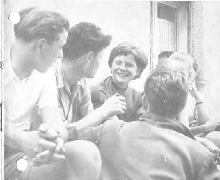
Auf einem IJGD-Lager ist es nie langweilig. Nach der Arbeit sitzt man bei einander und erzählt von der Heimat. Wäre das nicht etwas für Deine Ferien? Unser Bericht zeigt Dir, wie es dort zugeht und wie Du an einem IJGD-Lager teilnehmen kannst.