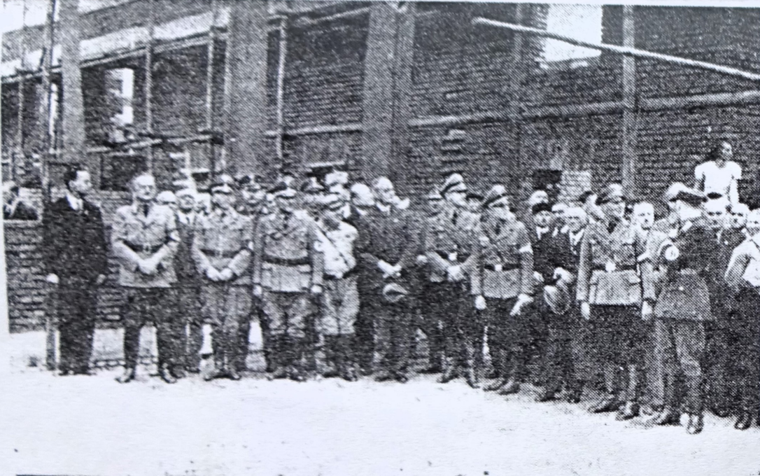
Die Festgäste vernehmen die Worte des Bürgermeisters.